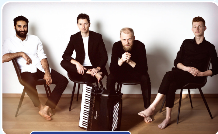
U' Elements (Lietuva)