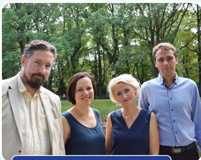
Ansamblis "Altera Veritas" (Latvija)