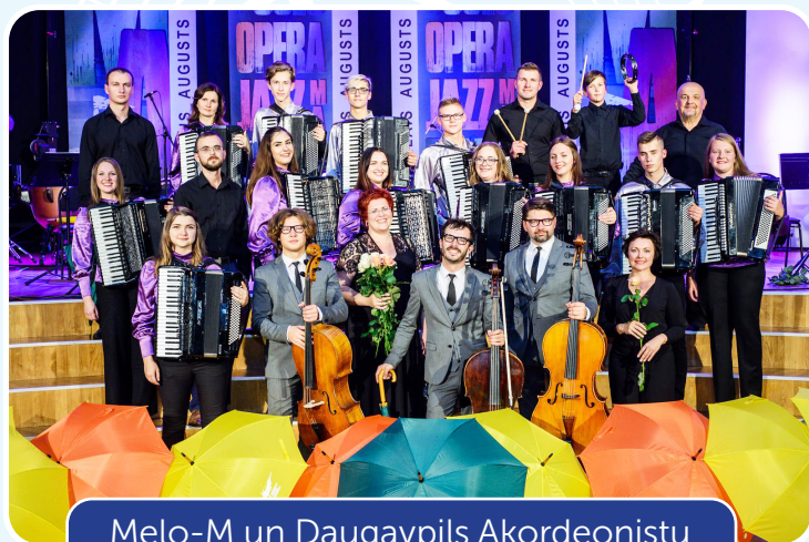
Melo-M un Daugavpils Akordeonistu orķestris (Latvija)