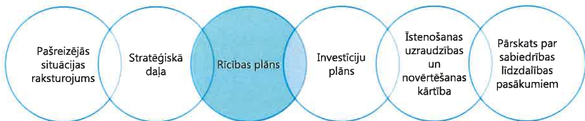
ATTĒLS 1. Daugavpils valstspilsētas un Augšdaugavas novada attīstības programmas 2022.-2027. gadam struktūra

Rīcības plānā nākošajiem septiņiem gadiem tiek noteiktas rīcības, kuras īstenojot pilsēta virzās uz Stratēģiskajā daļā noteiktajiem uzdevumiem, ilgtermiņa un vidēja termiņa mērķiem.