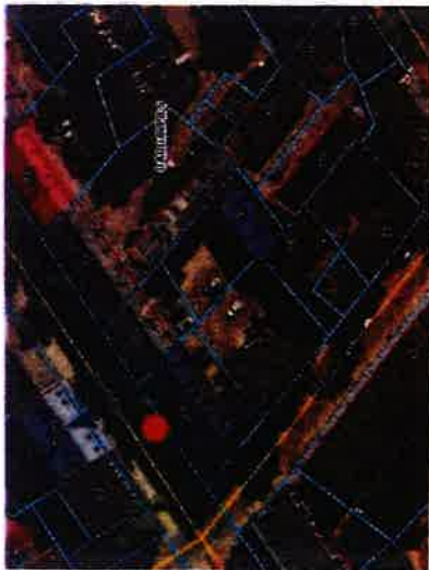
● - vasaras āra kafejnīcas atrašanās vieta