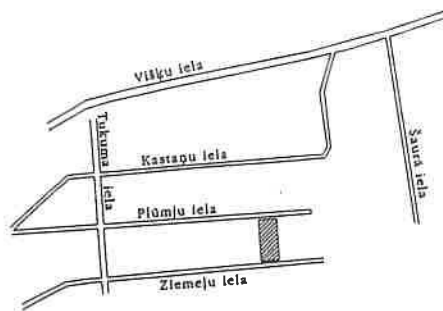
PLŪMJU IEĻA 28